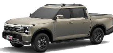
Desert Gold – matt szín